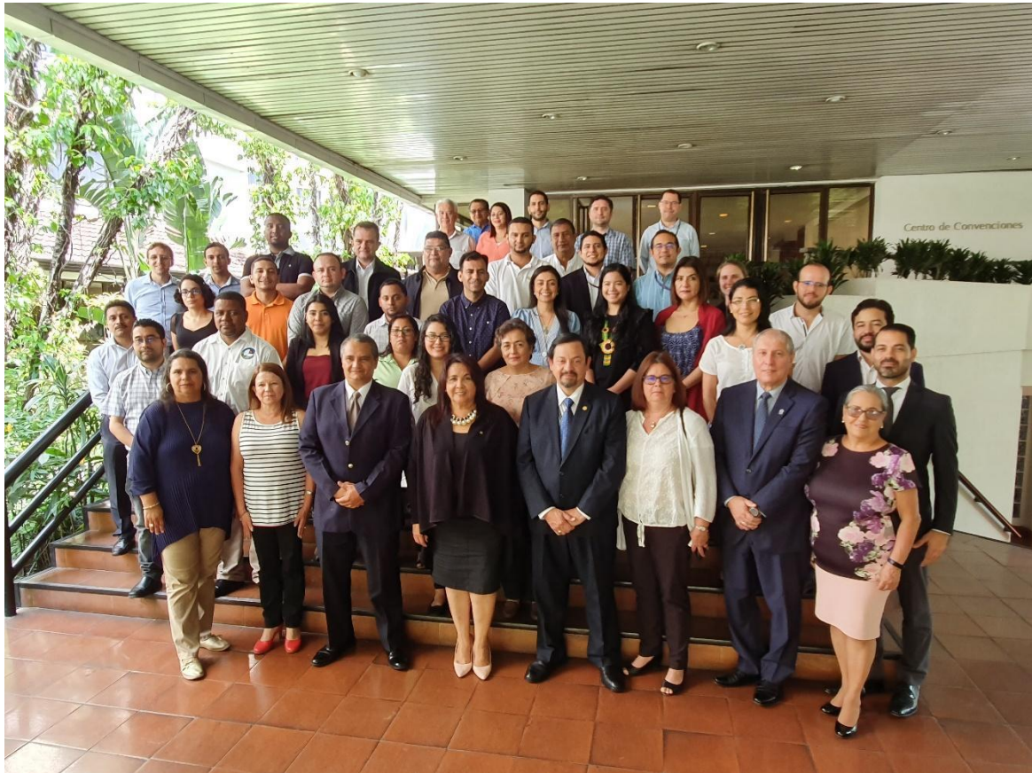
Figura 3. Grupo de trabajo que participó del LIX Foro del Clima de América Central, realizado en San José, Costa Rica, 17 y 18 de julio de 2019.